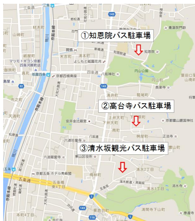
図1 主要な観光バス駐車場

本研究では団体客を対象とし、観光バス駐車場までの避難を想定するため、主要な観光バス駐車場を示す。